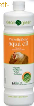
aqua oil Parkettpflege

Zur Auffrischung/Renovierung von strapaziertem, geöltem, schwarzen Parkett empfehlen wir aqua oil black. Für weiß geöltes Parkett empfehlen wir aqua oil white.