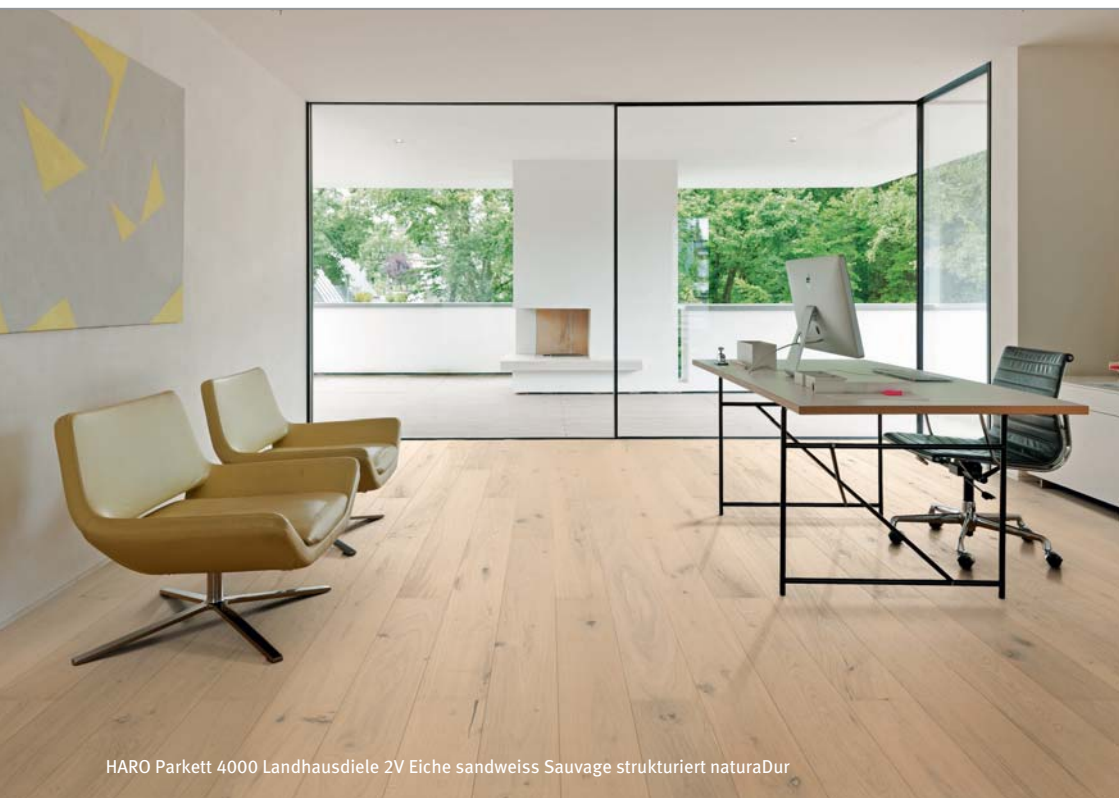
HARO Parkett 4000 Landhausdielen 2V Eiche sandweiss Sauvage strukturiert naturaDur

Hamberger Flooring GmbH & Co. KG Postfach 10 03 53 83003 Rosenheim Deutschland