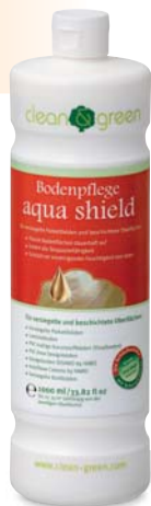
Bodenpflege aqua shield

Schnell, einfach, natürlich – Pflege für alle Böden